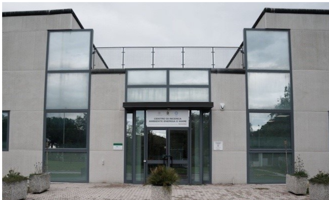
Tavola rotonda aperta alla cittadinanza sabato 25 novembre al Tecnopolo di Marina di Ravenna

22 Novembre 2023 “Fare città insieme”, evento aperto alla cittadinanza dedicato alla progettazione partecipata della Ravenna di domani, si configura come tappa intermedia di un percorso che ha già visto svolgersi a Ravenna due attività nella prima parte dell’anno: il corso online “Landscape education for democracy” sulla progettazione di azioni di trasformazione partecipata, il Community based design, e sulla gestione del paesaggio come bene comune, e la summer school “Against all odds - contro ogni previsione”, in cui 40 studenti provenienti dalle università di Atene, Nürtingen-Geislingen (Baden-Württemberg), Weihestephan-Triesdorf (Freising, Baviera), Agricoltura e Paesaggio di Budapest e dall’Università del Maryland (USA), sono stati chiamati a proporre percorsi di partecipazione per la costruzione di azioni condivise di riequilibrio e riprogettazione dei contesti locali sotto il coordinamento di UNIBO e di Fondazione Flaminia.