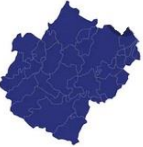
Tabella comuni Cesena