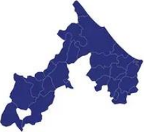
Tabella comuni Rimini