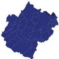
Tabella comuni Cesena